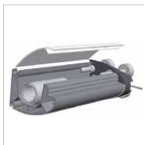
Terminale avvolgibile . Front Bar

Awning with special drawing system (cable) which joins permanently the roll to the front bar, always keeping the fabric tensioned in each position. This structure is endowed with electric motor and aluminium shutter-box. Painting by polyester following rigid qualitative standards. Ideal awning for skylights, verandas and for the application above/below wood pergolas. Its installation can be both horizontal and vertical, and in intermediate position. Advised structure for maximum dimensions of mt. 5.00 x 5.00 with acrylic fabric or mt. 4.00 x 4.00 with Filtrante 86-92 fabric. Current structure with electrical motor, accessible shutter-box and front bar for easy installation.