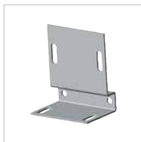
Art. 1627 Attacco a spallina . Rail support