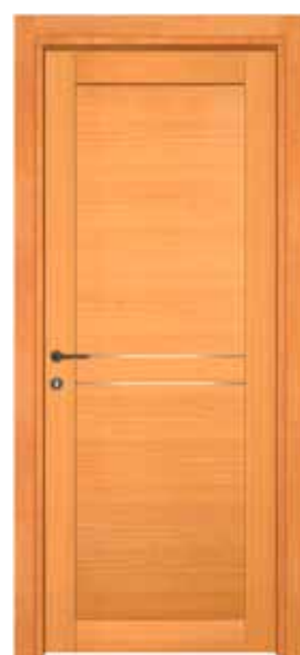
MOD 801 S alluminio 2