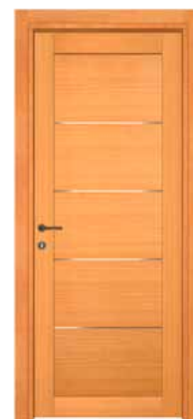
MOD 801 S alluminio 4