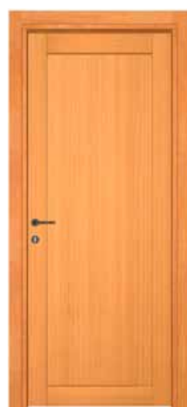
MOD 801 S